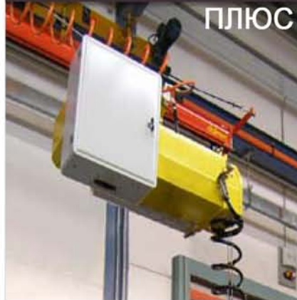
MINIPARTNER MPS PLUS